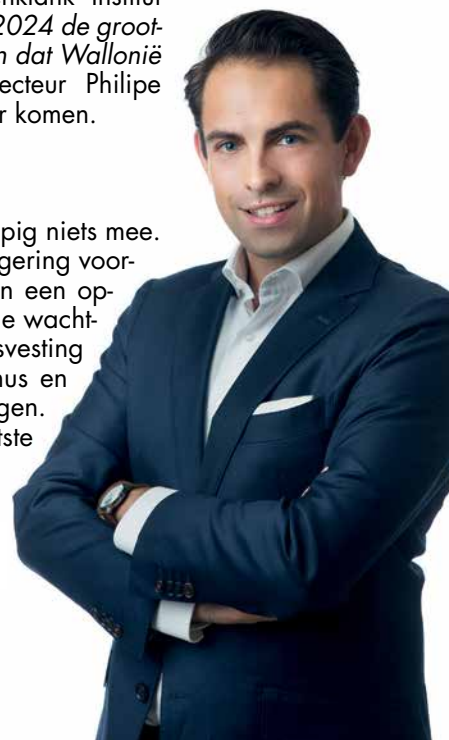
Tom Van Grieken Partijvoorzitter

Maar daar koopt de Vlaming voorlopig niets mee. Die krijgt met de nieuwe Vlaamse regering vooral oude wijn in nieuwe zakken. Van een oplopende rusthuisfactuur over stijgende wachtlijsten in de zorg en de sociale huisvesting tot de afschaffing van de woonbonus en de verhoging van de autobelastingen. De citroen moet blijkbaar tot de laatste druppel worden uitgeperst.