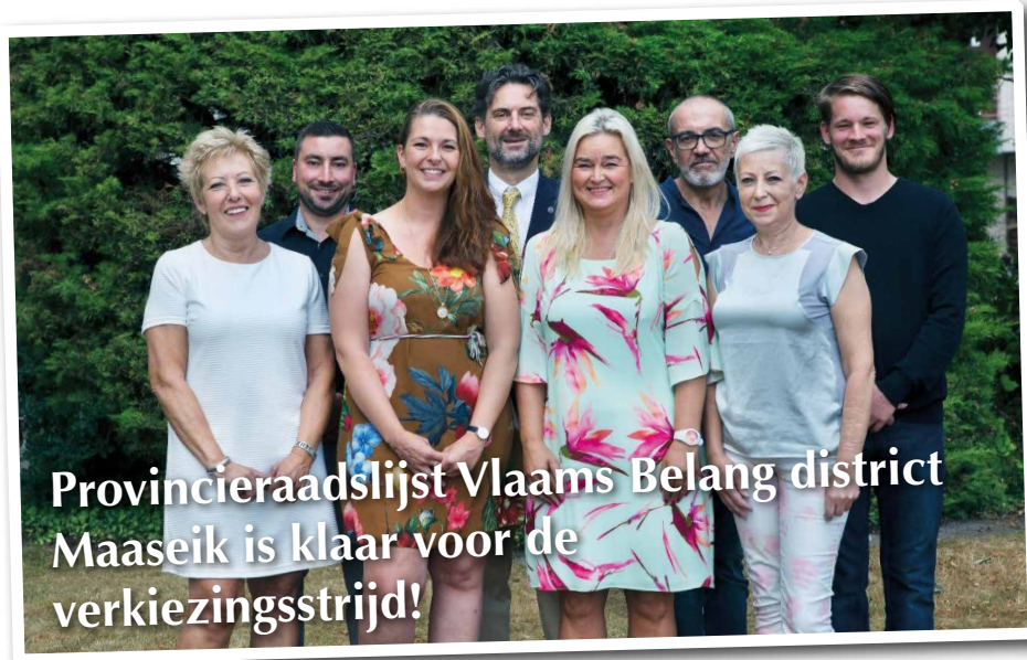
Provincieraadslijst Vlaams Belang district Maaseik is klaar voor de verkiezingsstrijd!