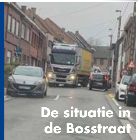
De situatie in de Bosstraat

Wij slaagden er in om samen met de burger reeds succes te boeken in de Boekent en omgeving, maar ook in de Bosstraat werd er actie met positief resultaat ondernomen.