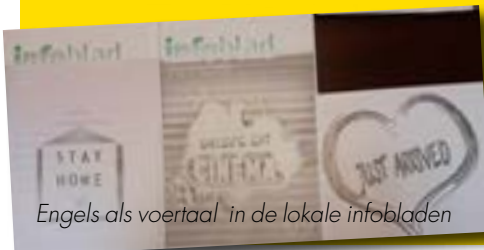
Engels als voertaal in de lokale infoblads

Pieter De Spiegeleer Fractieleider Vlaams Belang Haaltert