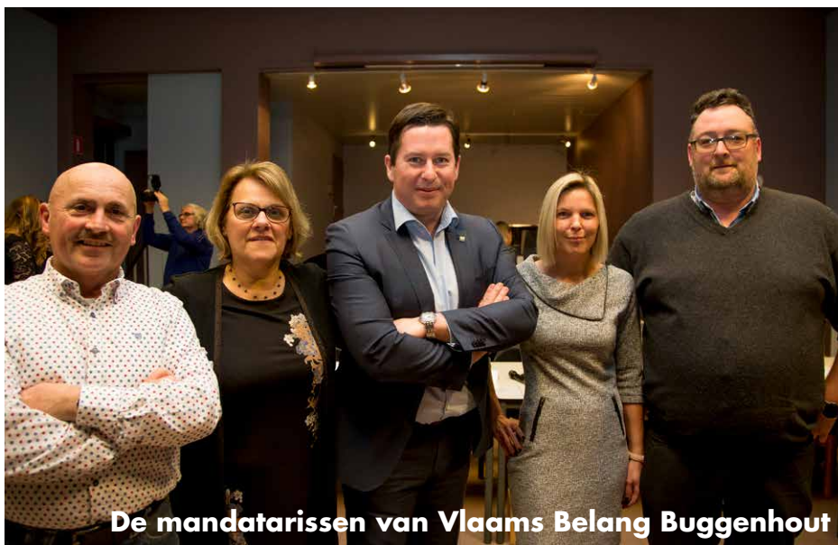
De mandatarissen van Vlaams Belang Buggenhout

Voor de kostprijs hoeft u het alvast niet te laten. Volwassenen betalen 14 euro en voor kinderen tussen 6 en 12 jaar is kostprijs maar 7 euro . Kinderen jonger dan 6 jaar eten zelfs helemaal gratis.