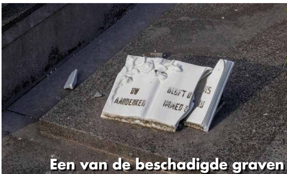
Een van de beschadigde graven

Fractievoorzitter Stijn Van Hamme besprak deze problematiek tijdens de gemeenteraad van eind augustus. Het gemeentebestuur was op de hoogte van slechts één melding, maar zal verdere stappen nemen om dit vandalisme aan te pakken. Dankzij het Vlaams Belang zal ook deze overlast aangepakt worden.