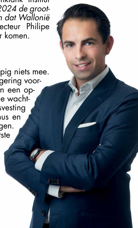
Tom Van Grieken Partijvoorzitter

Maar daar koopt de Vlaming voorlopig niets mee. Die krijgt met de nieuwe Vlaamse regering vooral oude wijn in nieuwe zakken. Van een oplopende rusthuisfactuur over stijgende wachtlijsten in de zorg en de sociale huisvesting tot de afschaffing van de woonbonus en de verhoging van de autobelastingen. De citroen moet blijkbaar tot de laatste druppel worden uitgeperst.