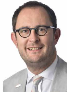
Vincent Van Quickenborne: "130 nationaliteiten in onze stad... wat een rijkdom"