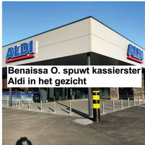
Benaissa O. spuwt kassierster Aldi in het gezicht