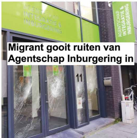
Migrant gooit ruiten van Agentschap Inburgering in