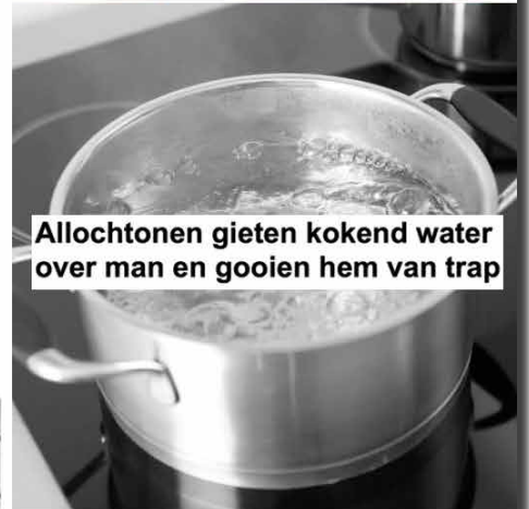
Allochtonen gieten kokend water over man en gooien hem van trap