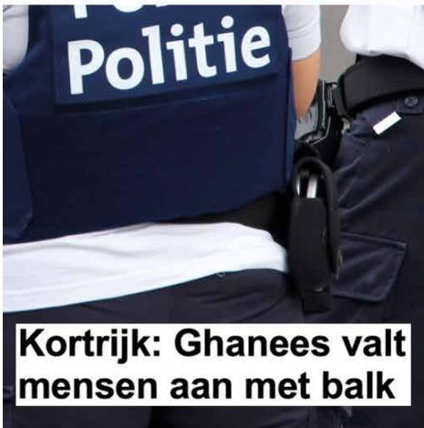
Kortrijk: Ghanees valt mensen aan met balk