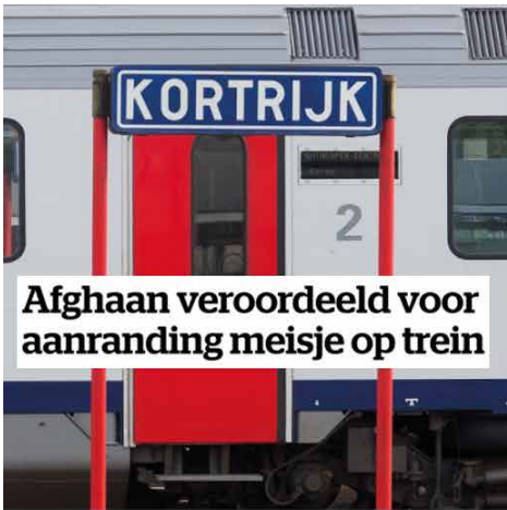
Afghaan veroordeeld voor aanranding meisje op trein