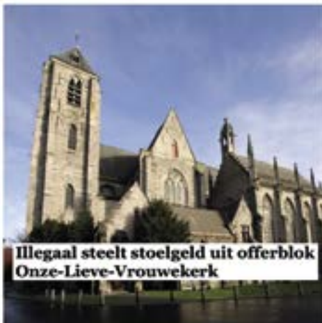
Illegaal steelt stoelgeld uit offerblok Onze-Lieve-Vrouwekerk