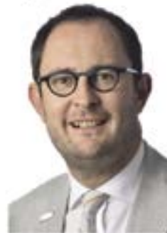
Vincent Van Quickenborne: "130 nationaliteiten in onze stad... wat een rijkdom"