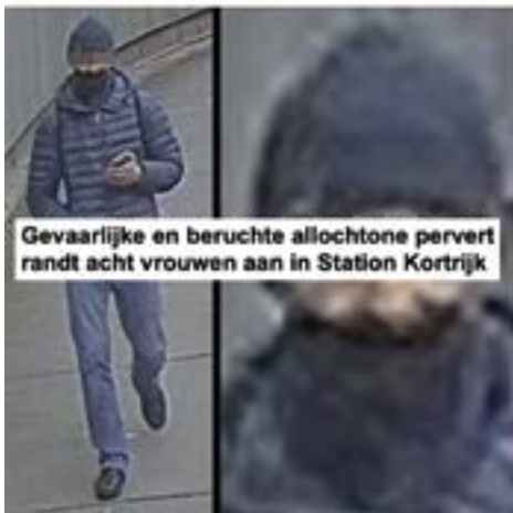
Gevaarlijke en beruchte allochtone pervert randt acht vrouwen aan in Station Kortrijk