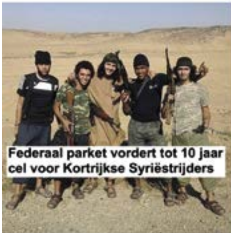
Federaal parket vordert tot 10 jaar cel voor Kortrijkse Syriëstrijders