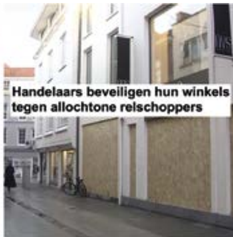
Handelaars beveiligen hun winkels tegen allochtone reischoppers