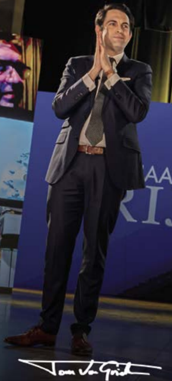
Tom Van Grieken Voorzitter

Voor het Vlaams Belang is het duidelijk: 2021 moet en zal het jaar van de vrijheid zijn. Dat wil niet zeggen dat we het coronavirus niet ernstig nemen. Net zoals wij aandacht hebben voor onze grondrechten en de mentale gezondheid van de burger. Daarom willen wij geen blinde lockdown, maar gerichtere en transparante maatregelen - die bewezen werkzaam zijn. Enkel een beter vaccinbeleid, betere testing en betere tracing kunnen ons uit de crisis loodsen. Dat is exact het omgekeerde van het beleid van De Croo en co. Hoog tijd dus voor verandering, hoog tijd voor het Vlaams Belang!