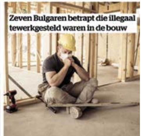
Zeven Bulgaren betrappt die illegaal tewerkgesteld waren in de bouw