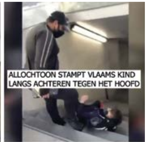
ALLOCHTOON STAMPT VLAAMS KIND LANGS ACHTEREN TEGEN HET HOOFD