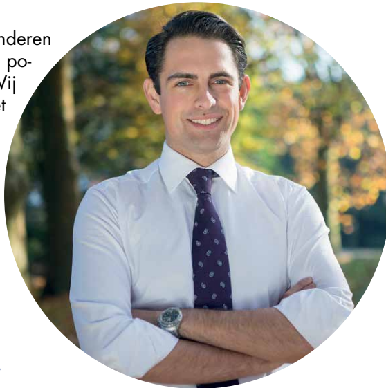
Tom Van Grieken Voorzitter

Met het Vlaams Belang maken we Vlaanderen weer van ons!