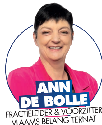
ANN DE BOLLE FRACTIELEIDER & VOORZITTER VLAAMS BELANG TERNAT