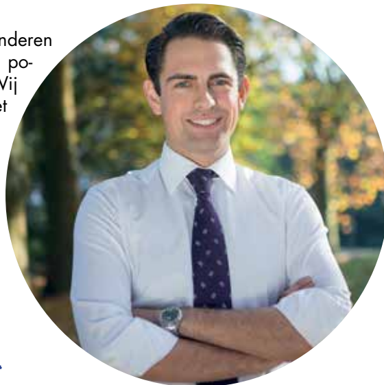
Tom Van Grieken Voorzitter

Met het Vlaams Belang maken we Vlaanderen weer van ons!